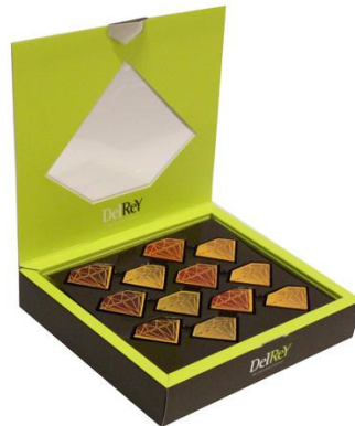
Slika 4: Diamantni pralineji