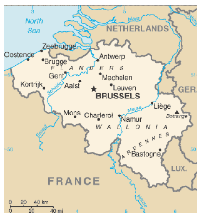
Slika 1: Belgija na zemljevidu

Antwerpen slovi kot diamantna prestolnica sveta. Je drugo največje mesto in občina v Belgiji in tudi glavno mesto pokrajine Flandrije.