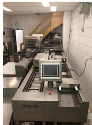
Slika 6: Ročno polnjenje diamantov