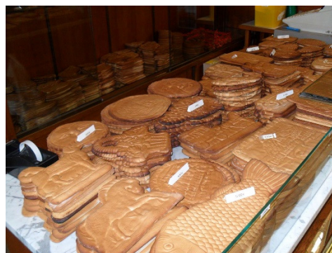
Slika 8: Couque biskvit

Ko govorimo o nočnem življenju Belgije, obstaja veliko možnosti, med katerimi lahko izbiramo – od najbolj intimnega in majhnega puba in mnogih nočnih klubov do hipnotičnega glasbenega festivala, kot je legendarni Tomorrowland.