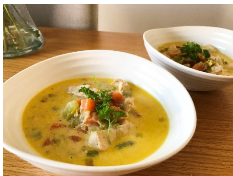
Slika 7: Waterzooi

Belgija ima veliko jedi, ki veljajo za tradicionalne samo v eni regiji države, lahko pa se najdejo tudi v drugih regijah. Takšne so na primer waterzooi iz Genta, couque biskvit iz mesta Dinant in tart au riz iz Verviersa.