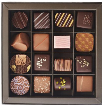
Slika 3: Različne vrste pralinejev

Imeli smo zelo raznoliko ponudbo različnih pralinejev (več kot 50), čokoladne diamante in srčke, čokoladne ploščice, čokoladne bonbone, različne čokoladne tablice po naročilu in s posebnimi napisi (valentinovo, obletnice, rojstni dnevi ...).