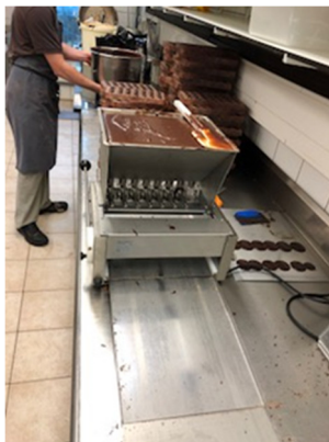
Slika 5: Tekoči trak za izdelavo pralinejev