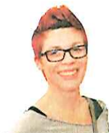
Teja iz Šentjurja:

« Odlična ponudba in odlična organizacija današnjega dogodka. Navdušena sem, ker je ponudba res pestra, prav vsak lahko nekaj najde zase. So tako manjši ponudniki, ki se drugače nimajo možnosti predstaviti, kot tisti, ki so na trgu še kako navzoči. In najdeš vse – od zdrave prehrane do predelanih izdelkov. Še več takšnih dogodkov bi moralo biti tukaj v Celju.