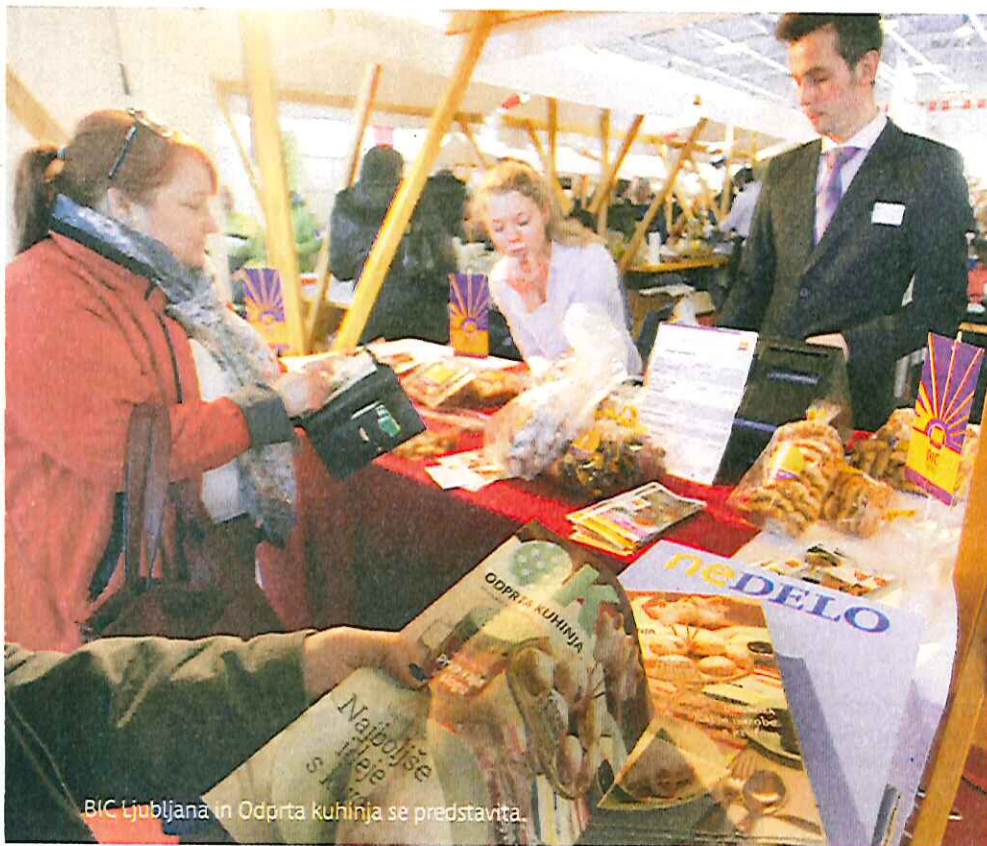
BIC Ljubljana in Odprta kuhinja se predstavita.