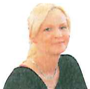
Viktorija iz Šmarja pri Jelšah:

« Danes smo prvič na takšnem kulinarčnem sejmu in moram reči, da je odlično. Za otroke je zelo lepo poskrbljeno z vsemi igrali, delavnicami in spremljevalnim programom. Mož degustira piva, jaz pa sem šla s hčerama malo naokoli in nam je res všeč. Seveda pa smo se ustavile pri igralih in napihljivih toboganih.